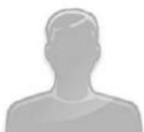
Фото (по желанию)

НАЗВАНИЕ СТАТЬИ (TIMES NEW ROMAN, 16 PT., ПОЛУЖИРНЫЙ, ПО ЦЕНТРУ)